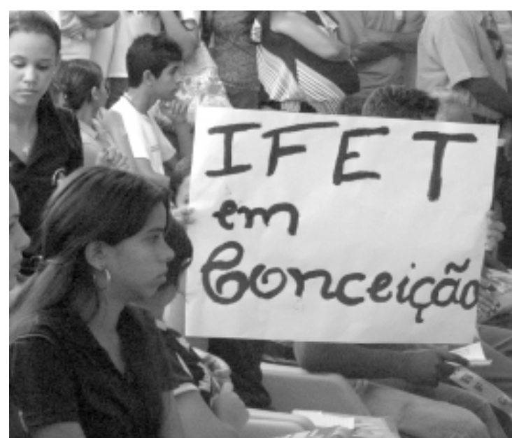
Estudantes foram à Câmara dia 5 cobrar escola federal para Conceição